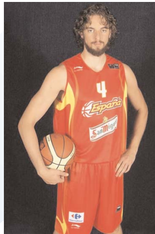
Pívot: Foto de Pau Gasol.