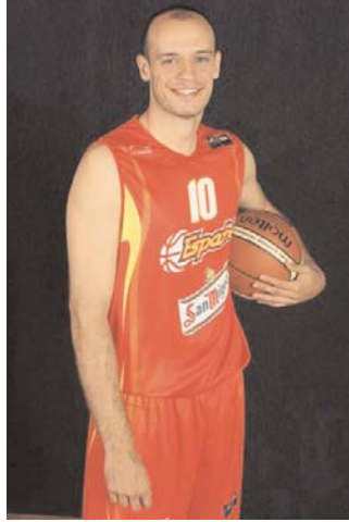
Alero: Foto de Carlos Jiménez