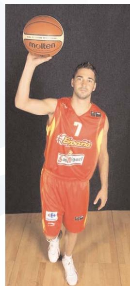
Escolta: Foto de Navarro