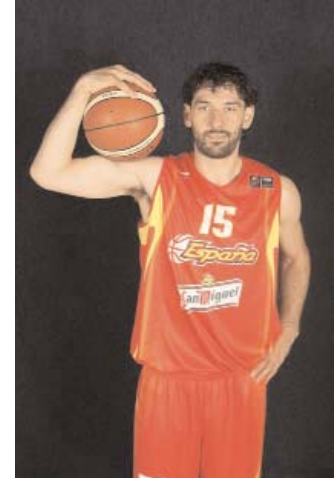
Ala-Pivot: Foto de Garbajosa