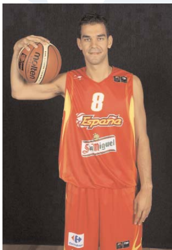
Base: Foto de JM. Calderón

Estos son algunos jugadores de la selección española masculina por posiciones: